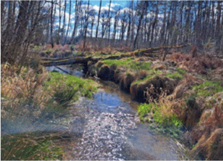
Foto: Ein naturnahes Gewässer mit unterschiedlichem Bewuchs bietet eine große Vielfalt für Lebewesen, aber auch zur Erholung.

Dieser Text entstand in Zusammenarbeit der Fachberaterinnen und Fachberater Gewässer des Landesamtes für Umwelt, Landwirtschaft und Geologie und der unteren Wasserbehörde des Landkreises.